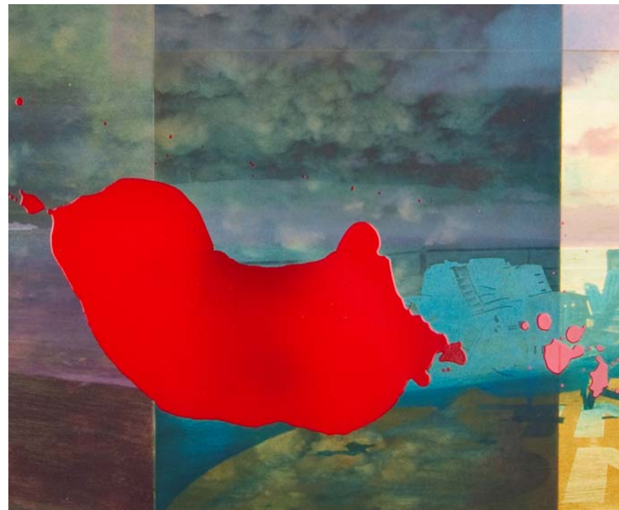
Detalj og helhet, 112x75cm, fra serien Horisont, monotypikk og lakk på papir, Rita Marhaug 2012