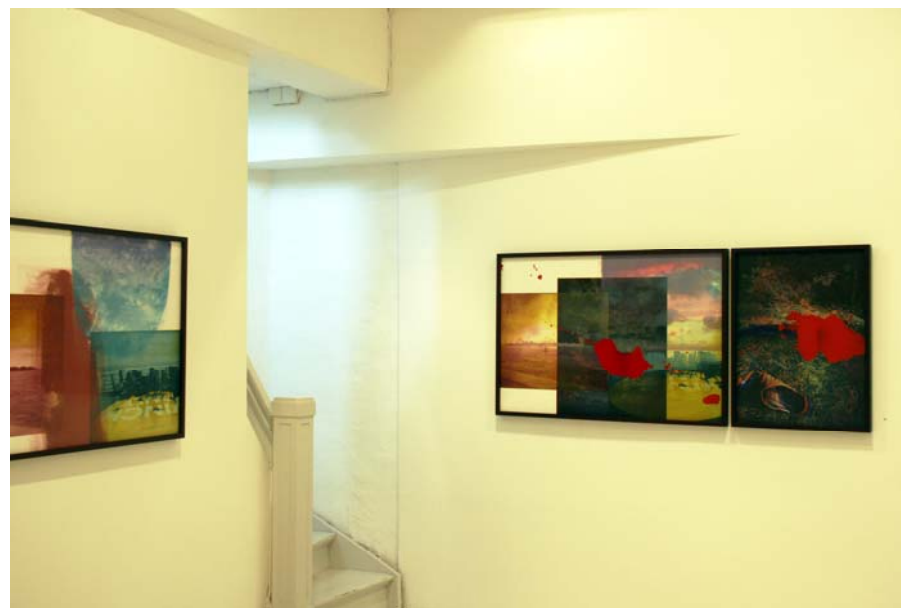
Bilde fra utstillingen Tilfeldige tanker , Galleri Allmenningen Rita Marhaug 2012

Prosessen bak hvert enkelt panel eller bildegruppe er både omstendelig og langsom. Egne fotografiske motiv er grunnlaget for produksjon av fargeseparerte trykkplater. Motivplatene benyttes sammen med abstrakte bildeparti i monetrykkteknikk med en arbeidsmetode der også spontane avgjørelser får plass.