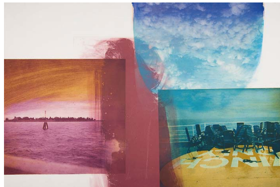
112x75cm, fra serien Horisont, monotrykk på papir, Rita Marhaug 2012