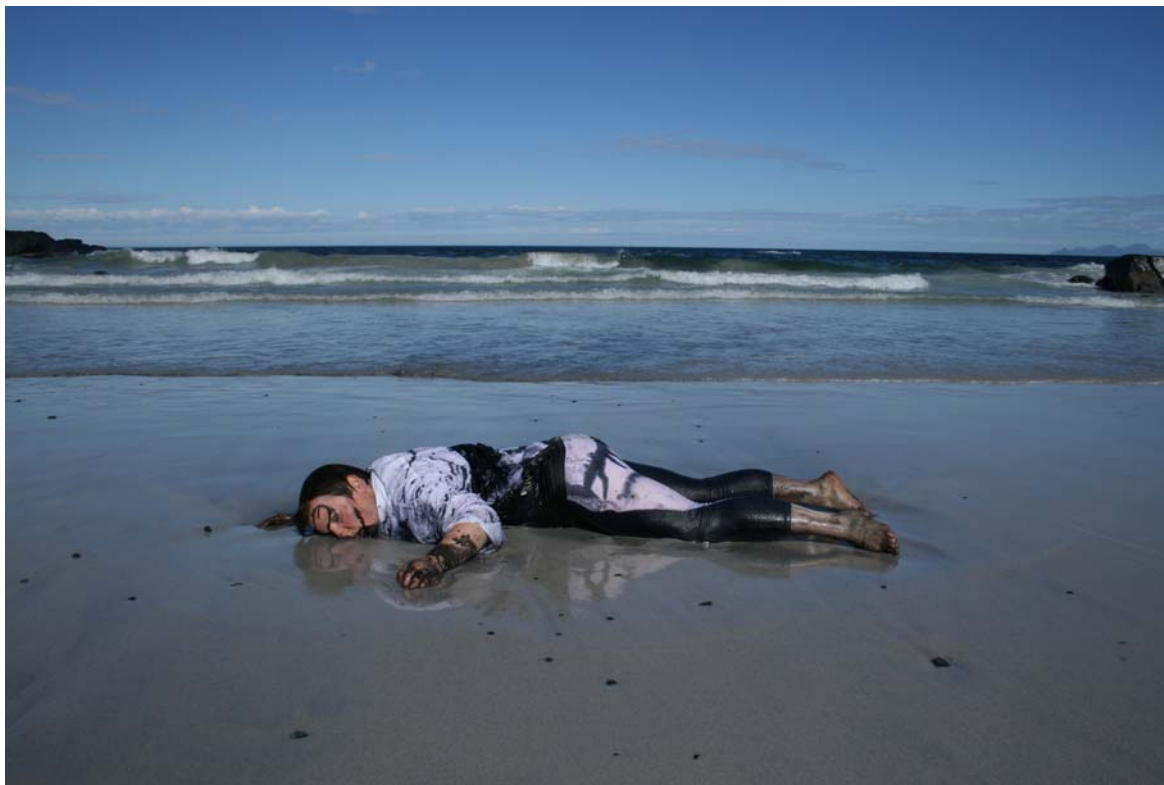
Fra Warszawa 19. mai 2012 Fra Gimsøya, Lofoten 6. august 2011

Gjennom de siste årene har hun arbeidet med en serie performanceverk under samletittelen Norwegian Liquid. Ulike fargede væsker har blitt brukt til å "renne inn og ut" av kroppen hennes under visningene. Vi skal ikke her begi oss inn på detaljerte beskrivelser, men viser et par eksempler fra siste år.